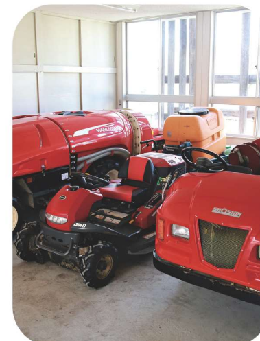
▲農機具バンクで利用できる機械の一例