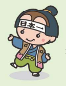
大江町スペシャルサポーター「日本一くん」

大江町は、山形県のほぼ中央に位置しています。豊かな自然に恵まれ、さくらんぼ・ラフランス・りんごなどのフルーツが自慢。町場はかつて最上川舟運の港町として栄え、往時のにぎわいを思わせる町並みが、レトロな雰囲気を醸し出しています。JR左沢線を利用すれば、通勤・通学にも便利です。町中心部から寒河江市まで車で約10分、山形市中心部までは約40分と、そう遠くありません。居心地が良く、どこかほっとする——そんな大江町で暮らしてみませんか。