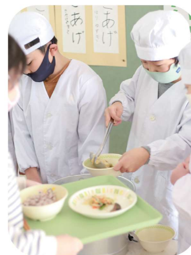
▲小学校では校内調理のほかほか給食を提供

遊ぶことを大切にしている私立幼稚園です。特に、運動遊びや、町内の施設、自然を活かした園外活動を進んで実施しています。豊かな環境の中で夢中になって遊び子どもたちの瞳が輝いています。通園バス補助を受けバスを利用することができます。入園は満3歳児~5歳児まで