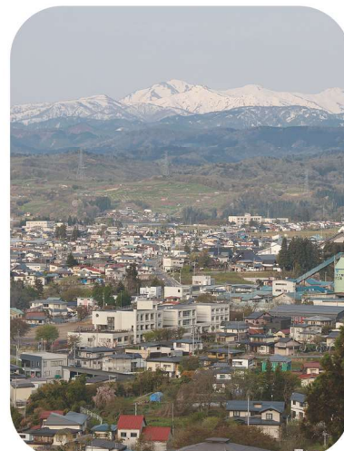
▲左沢の街並みと朝日連峰