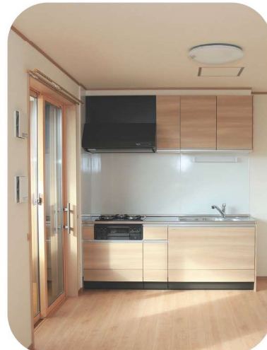
▲家賃補助の対象にもなる町営住宅