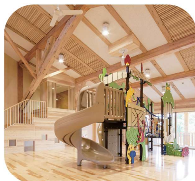
▲子育て支援センター「ばれっと」